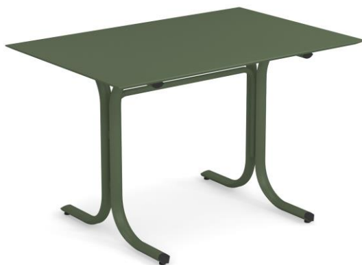
Table System ist die innovative Tischkollektion, entworfen im EMU Forschungs-zentrum, um den vielfältigen Ansprüchen des Objektgeschäfts gerecht zu werden; ein umfassendes Sortiment aus runden, quadratischen und rechteckigen Tischen mit festen und abnehmbaren Tischplatten. Diese Serie zeichnet sich durch die vielseitigen Einsatzmöglichkeiten aus, wobei die Tische sich ganz natürlich in jede Umgebung einfügen und sich mit allen Stühlen der EMU-Kollektionen kombinieren lassen.