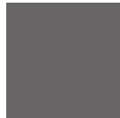
Grau NCS S 6500-N