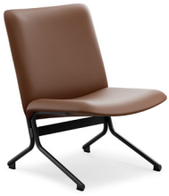
20H ( Slim )