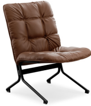
21H ( Fluffy )