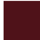
Burgunderrot RAL 3005