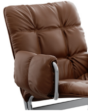
2PF 1 Armlehnen mit gepolstertem Armlehnenbezug