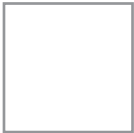
Weiß RAL 9016