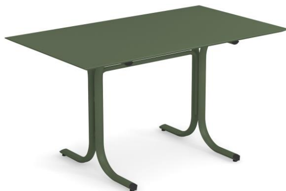
Table System ist die innovative Tischkollektion, entworfen im EMU Forschungs-zentrum, um den vielfältigen Ansprüchen des Objektgeschäfts gerecht zu werden; ein umfassendes Sortiment aus runden, quadratischen und rechteckigen Tischen mit festen und abnehmbaren Tischplatten. Diese Serie zeichnet sich durch die vielseitigen Einsatzmöglichkeiten aus, wobei die Tische sich ganz natürlich in jede Umgebung einfügen und sich mit allen Stühlen der EMU-Kollektionen kombinieren lassen.